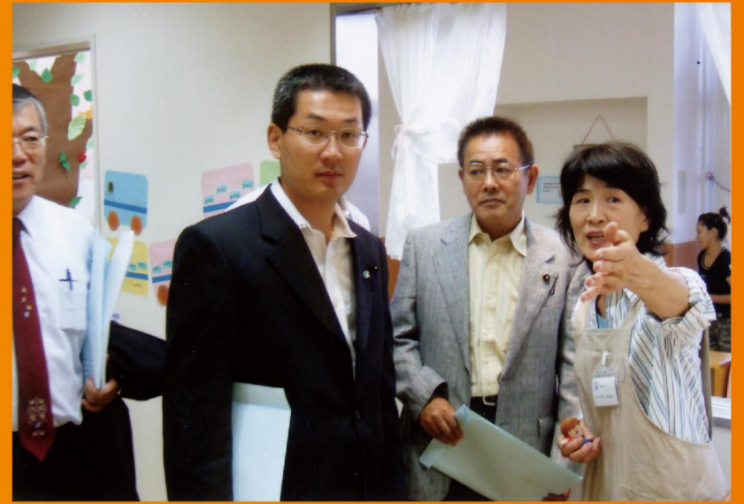
介護職員の収入状況(年収試算額) 19年度

A <健康福祉部長 答弁> 介護福祉士等修学資金貸付制度は、今年度から貸付限度額や貸付枠などの充実を図ったところ、昨年に比べ3倍以上の利用となっており、これからの入学者にとっても魅力的な制度になったと考える。制度の周知については、各介護福祉士等養成施設では、高等学校や中学校の進路指導に合わせて来年度の入学者の募集をすでに開始しているが、その際パンフレットを活用して、貸付制度のPRに努めている。また、そのほかの多くの若い世代の方々にも、この制度を利用して介護の仕事を目指していただけるよう、県や愛知県社会福祉協議会のホームページに掲載するほか、「福祉の就職総合フェア」でパンフレットを配布するなど機会を捉えて制度のPRに努めていきたい。