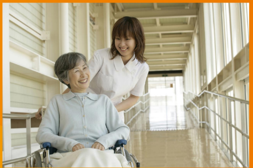
愛知県内養成施設の入学状況